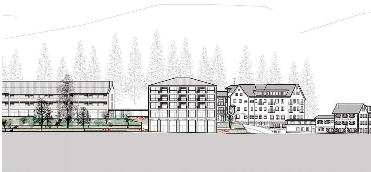
Die Ansicht der Neubauten und des bestehenden Hauses Parc von der Hauptstrasse her.